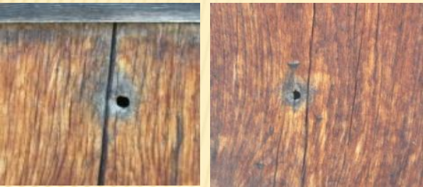
菊光堂南側にある戊辰戦争時の弾痕跡。一定方向の向館から撃たれている。